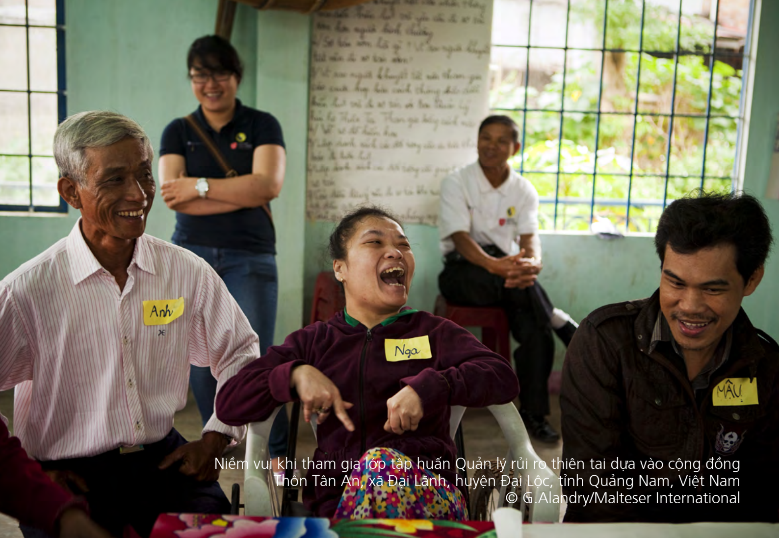
Niềm vui khi tham gia lớp tập huấn Quản lý rủi ro thiên tai dựa vào cộng đồng Thôn Tân An, xã Đại Lãnh, huyện Đại Lộc, tỉnh Quảng Nam, Việt Nam