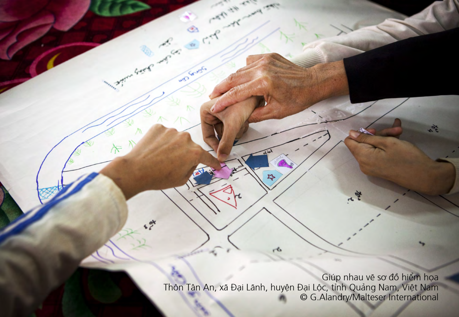
Giúp nhau vẽ sơ đồ hiểu họa Thôn Tân An, xã Đại Lãnh, huyện Đại Lộc, tỉnh Quảng Nam, Việt Nam