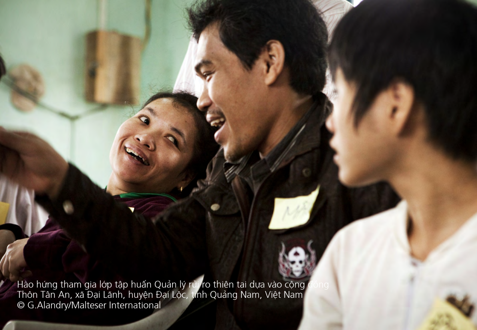
Hào hứng tham gia lớp tập huấn Quản lý rủi ro thiên tai dựa vào cộng đồng Thôn Tân An, xã Đại Lãnh, huyện Đại Lộc, tỉnh Quảng Nam, Việt Nam