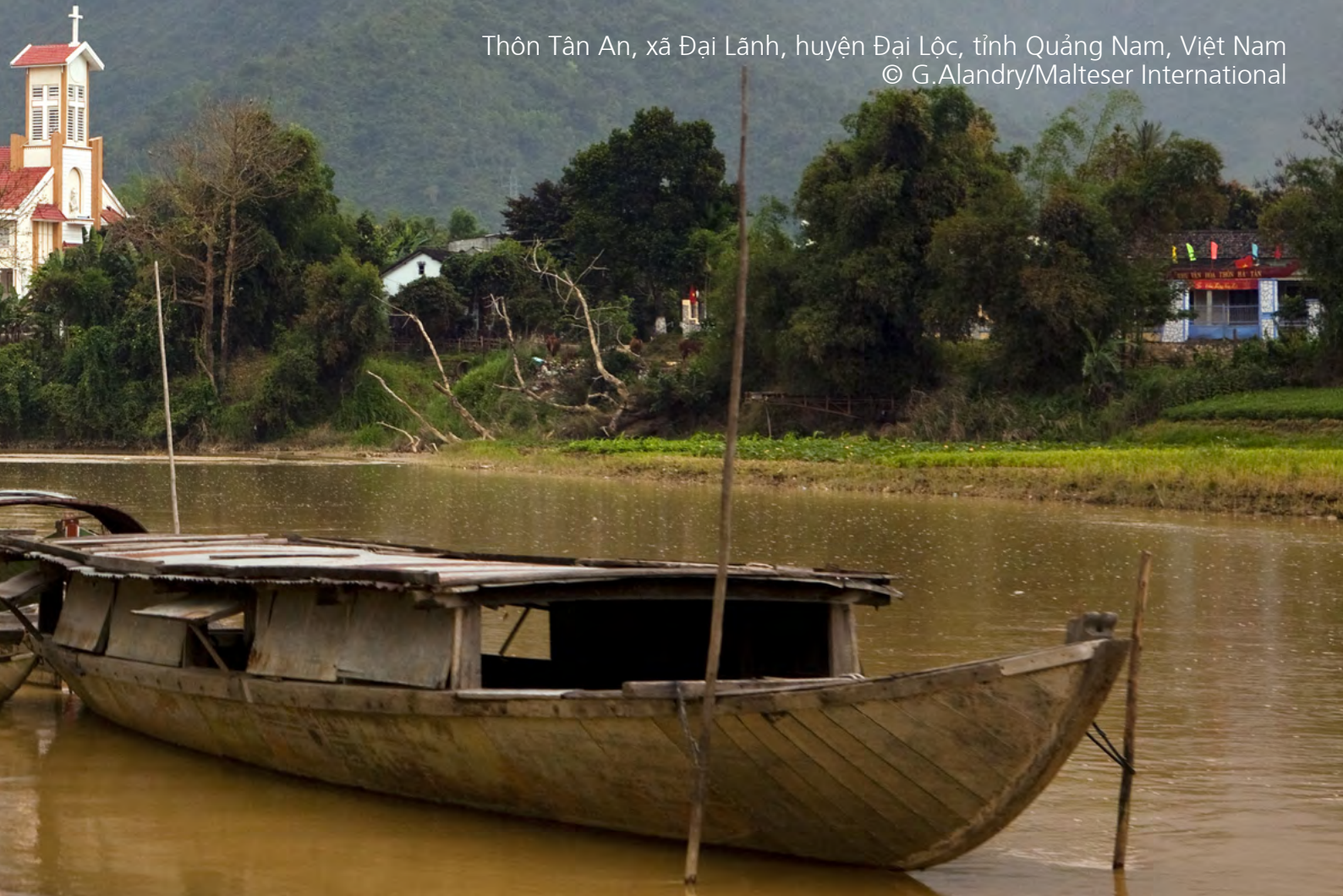
Thôn Tân An, xã Đại Lãnh, huyện Đại Lộc, tỉnh Quảng Nam, Việt Nam