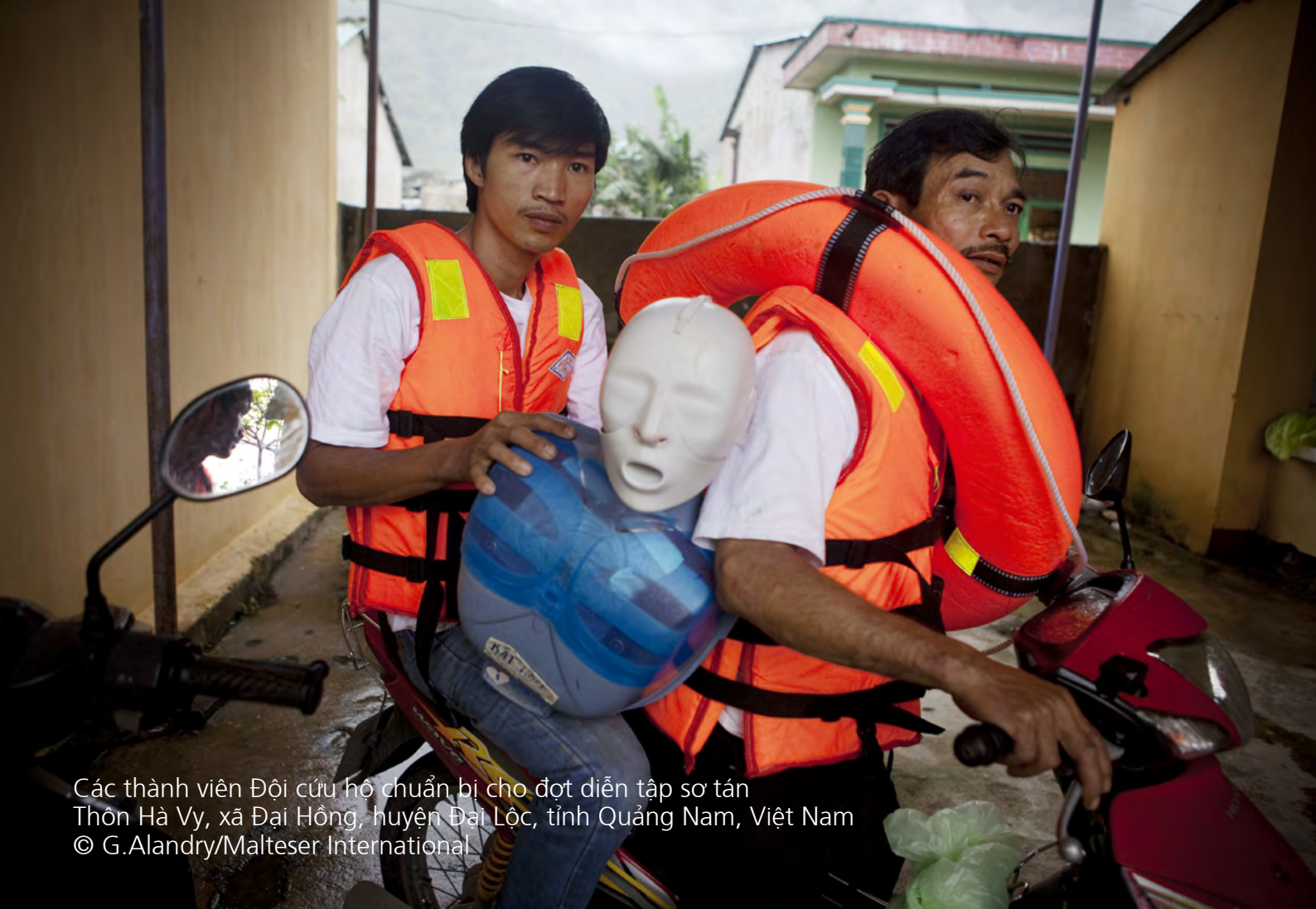
Các thành viên Đội cứu hộ chuẩn bị cho đợt diễn tập sơ tán Thôn Hà Vy, xã Đại Hồng, huyện Đại Lộc, tỉnh Quảng Nam, Việt Nam