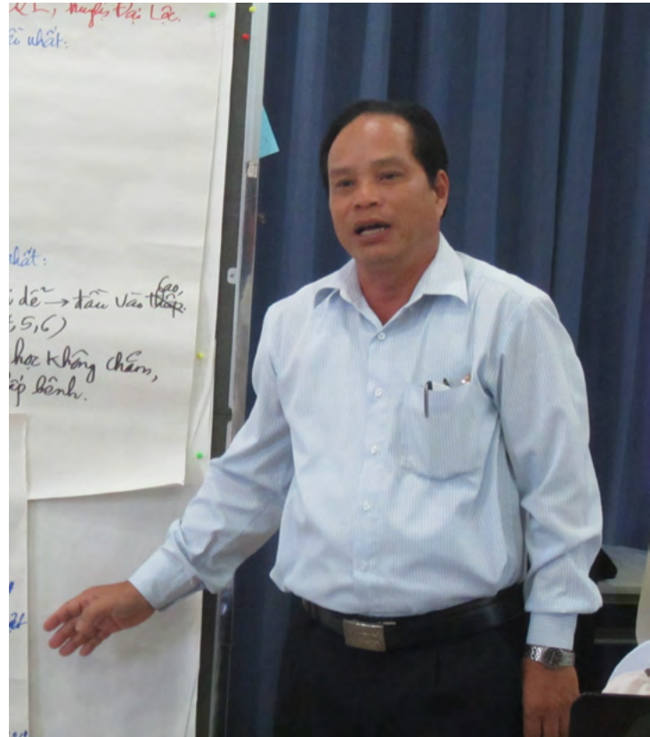
Phạm Bằng Hội Chữ thập đỏ tỉnh Quảng Nam.

sớm và sơ tán ưu tiên cho các đối tượng dễ bị tổn thương trong cộng đồng. Bản thân tôi được tham gia nhiều hội thảo, hội nghị chia sẻ các thông tin liên quan đến dự án nên đã bổ sung được nhiều kiến thức trong quản lý rủi ro thiên tai, nhờ đó tự tin hơn trong công việc của Hội.