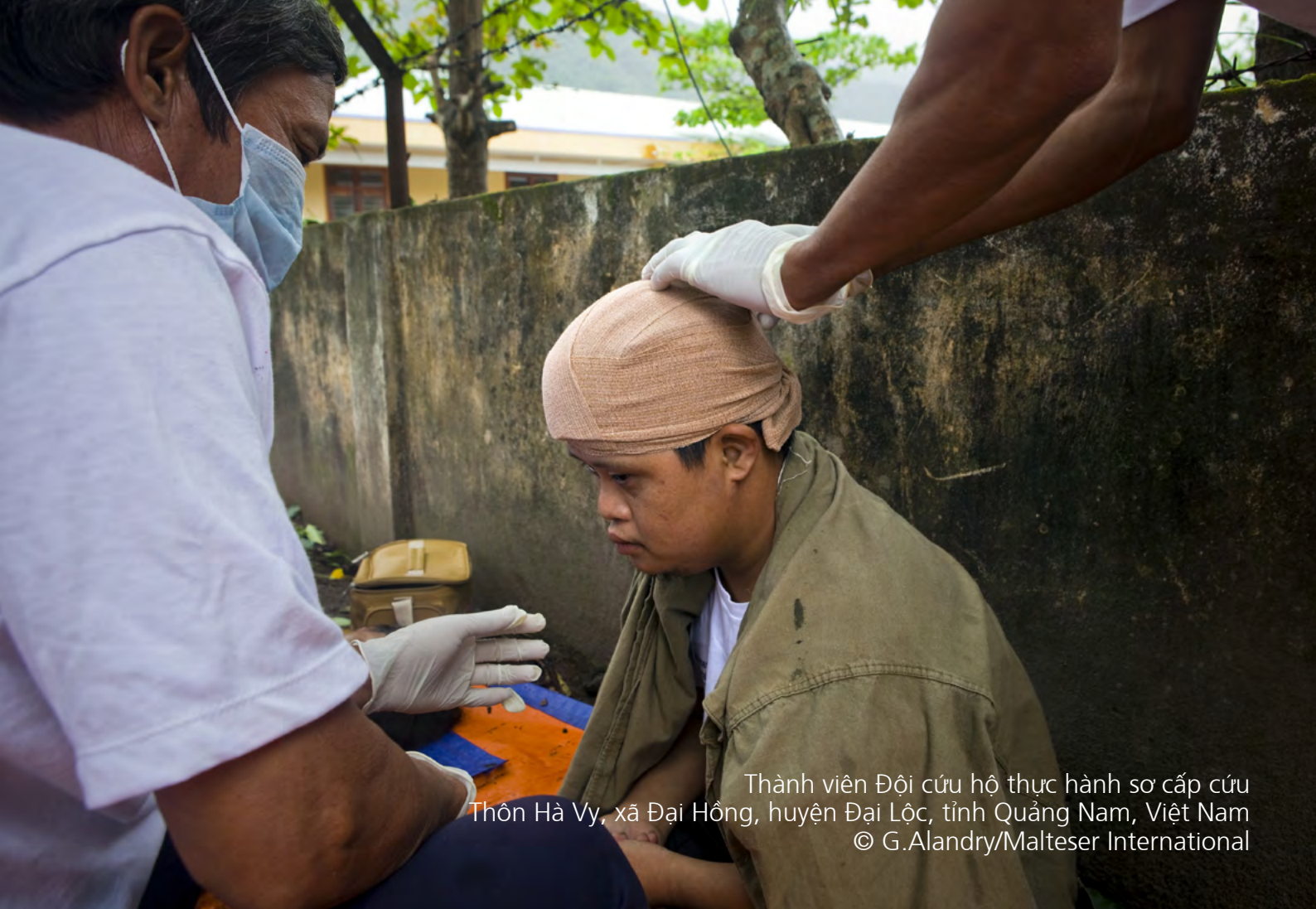
Thành viên Đội cứu hộ thực hành sơ cấp cứu Thôn Hà Vy, xã Đại Hồng, huyện Đại Lộc, tỉnh Quảng Nam, Việt Nam