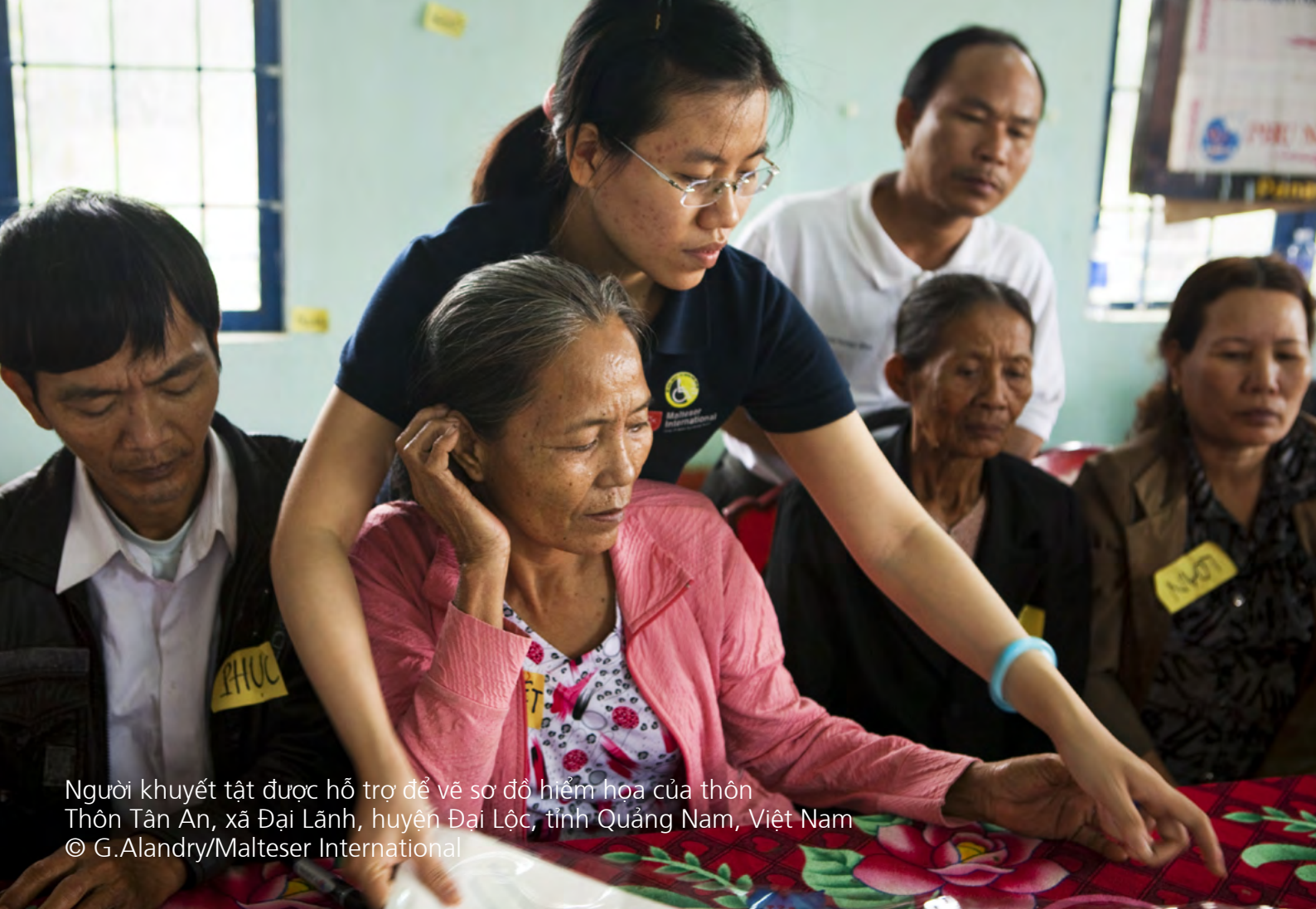
Người khuyết tật được hỗ trợ để vẽ sơ đồ hiểm họa của thôn Thôn Tân An, xã Đại Lãnh, huyện Đại Lộc, tỉnh Quảng Nam, Việt Nam