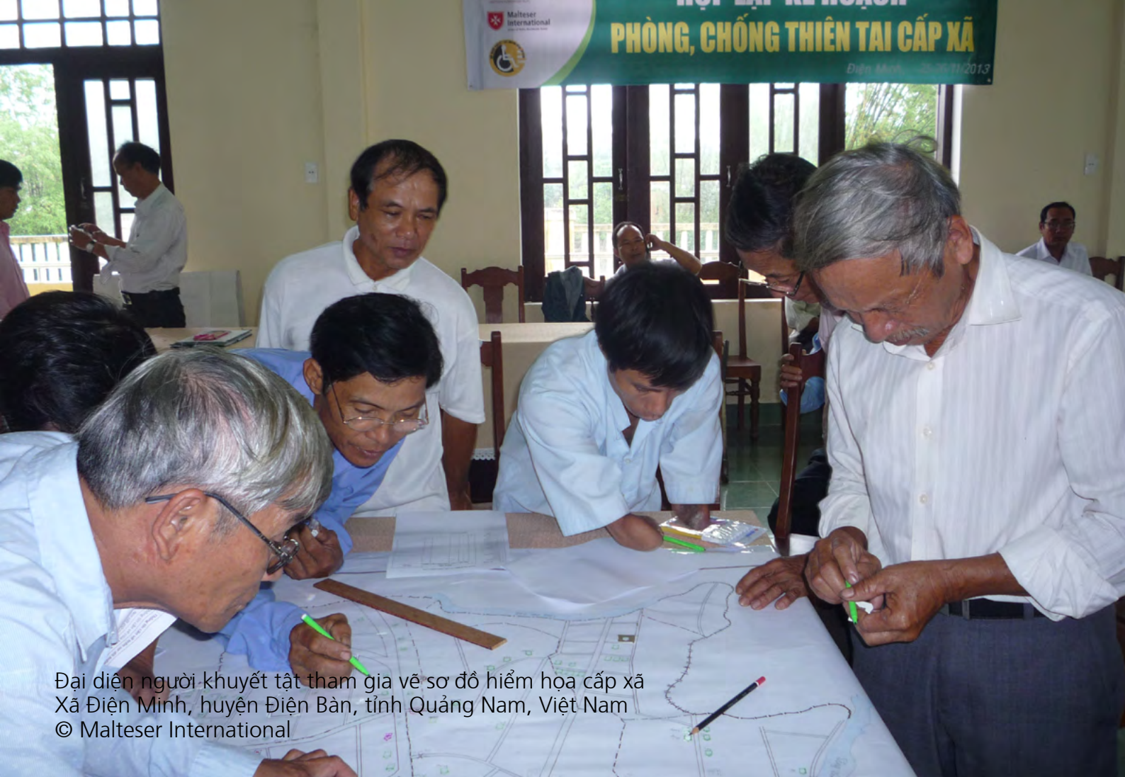
Đại diện người khuyết tật tham gia vẽ sơ đồ hiểm họa cấp xã Xã Điện Minh, huyện Điện Bàn, tỉnh Quảng Nam, Việt Nam