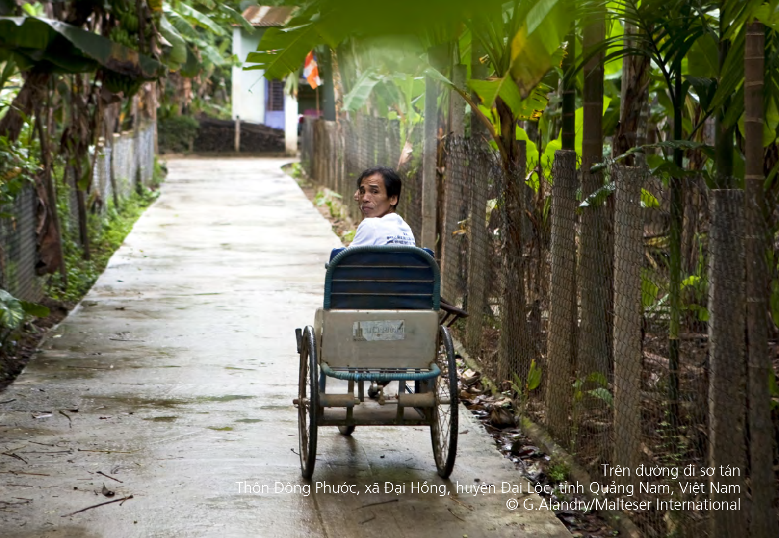
Trên đường đi sơ tán Thôn Đồng Phước, xã Đại Hồng, huyện Đại Lộc, tỉnh Quảng Nam, Việt Nam