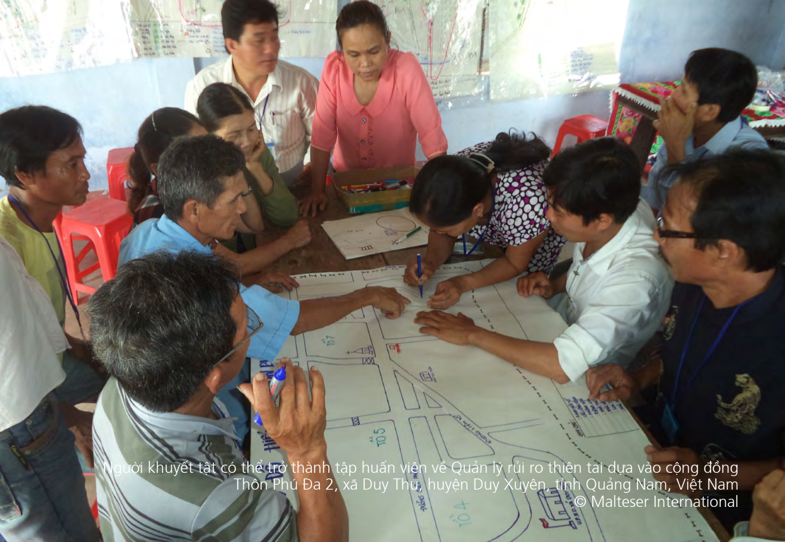
Người khuyết tật có thể trở thành tập huấn viên về Quản lý rủi ro thiên tai dựa vào cộng đồng Thôn Phú Đa 2, xã Duy Thu, huyện Duy Xuyên, tỉnh Quảng Nam, Việt Nam